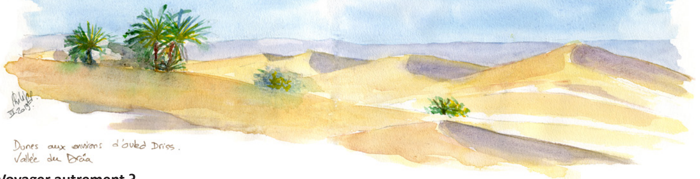
Dunes aux environs d'Ouled Driss. Vallée du Draa