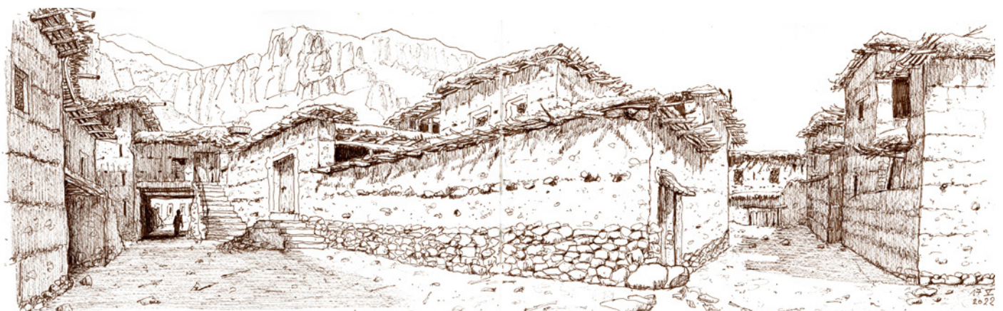
Au cœur du village d'Arous

Il peut être utile d'avoir votre nuancier au début ou à la fin du carnet, comme ça vous pouvez facilement le retrouver.