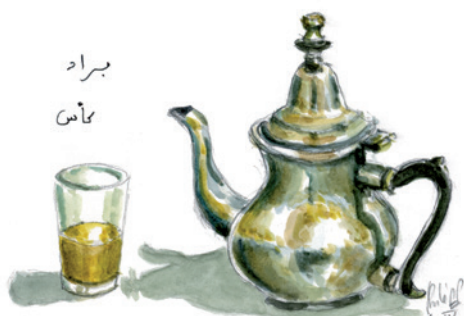
l'Inévitable théière et le thé à la menthe, symbole de l'hospitalité marocaine. (ici celle du gîte d'ASSAKA)